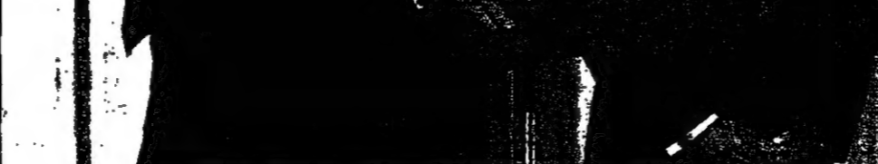
دعس الوزراء الاسرائيلي وبيناميتش تيتياهو الرئيس الامريكى بيل كلينتون في المؤتمر الصحافي

وقال داين ان ما خلفه هذا الامل طال هذه للده هو تحول داين الى رجل وطني يعد التصارات اسرائيل في عامي 1966 و1967 مشيرة الى ان الفئري تعرض للايذاء وقبول بالكرامه بسبب حملته لكشف اعمال داين في الكيبوتس وفي المزارع ايضا.